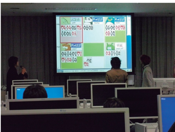
コンピュータ大貧民大会の様子