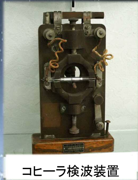
コヒーラ検波装置

電気通信技術の原点をたどり、未来につなぐ連続トークイベントが始まります。第1回は18世紀末から19世紀末にかけての電気通信黎明期の歴史をもっとも原始的な無線通信方式である火花放電とコヒーラ検波器の実演も交えて紹介。無線通信誕生の現場を体験することができます！