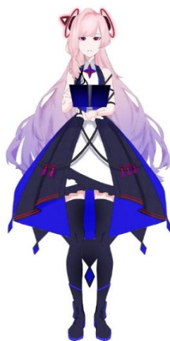
«VTuber 「fuwari」 »

自身の YouTube チャンネルでは、ミュージックビデオに加え、AI 講座や AI から提案されたレシピでのパン作りなどを配信中。