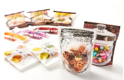
梨地フィルムを用いた食品包装

DICは、時代の変化を見据えた新素材を創出するため、2013年より感性ニーズを発現させる素材の研究開発を継続的に進めています。製品開発の一例として、フィルム自体に意匠性を持たせ、和紙のような風合いの外見と表面に梨皮のような独特な触感を持たせ、高級感を付与した梨地フィルムがあります。