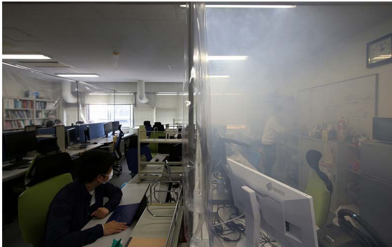
ビニールシート遮蔽によってマイクロ飛沫が滞留する様子(特殊スモークによる再現実験)

この調査は本学に加え、産業医科大学、宮城県結核予防会の研究者によって、実際にクラスターが発生した宮城県内の事務室を調査し、当時の換気状況を CO 2 ガスにより測定し、さらに熱流体シミュレーションによってマイクロ飛沫の挙動を分析したものです。