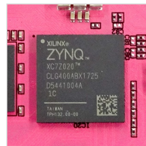
今回の実装評価に用いた FPGA ボード（Digilent 社 Pynq-Z1）（写真左）。中央にある黒い部品が FPGA チップ（Xilinx 社 Zynq-7000）（写真右）